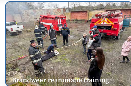
Brandweer reanimatie training

Op de website www.stichting-ozo.nl staat onder de knop 'volg ons' een dagelijks verslag van het werkbezoek.