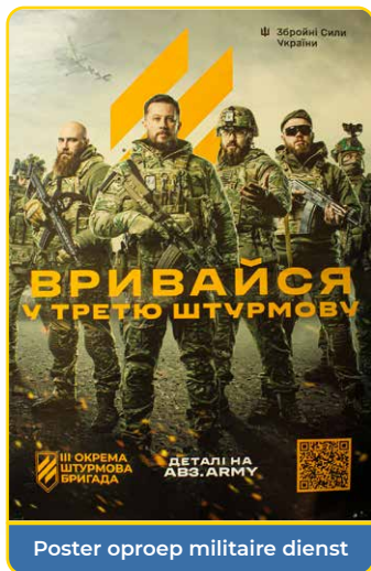
Poster oproep militaire dienst

'zomaar' voor het leger op hardhandige wijze 'geronseld' kunnen worden. Hierover doen aangrijpende verhalen de ronde. Dat veel mensen vertrokken zijn naar elders heeft ook tot gevolg dat er schaarste is aan personeel en vakmensen voor onderhoud aan bijvoorbeeld Rehoboth.