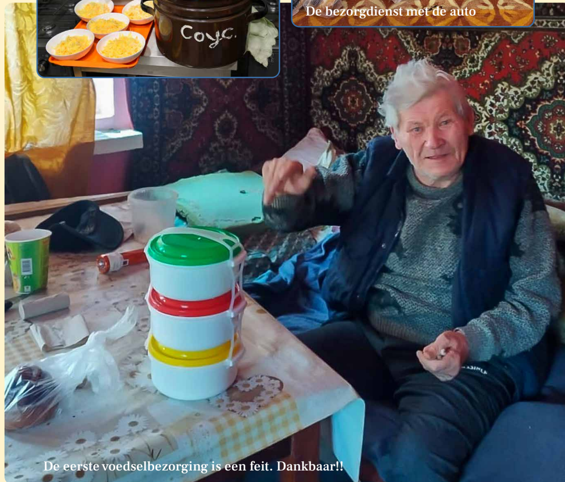
De eerste voedselbezorging is een feit. Dankbaar!!