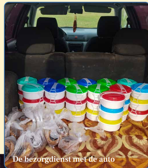
De bezorgdienst met de auto