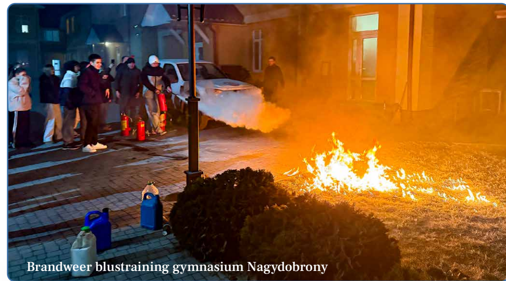
Brandweer blustraining gymnasium Nagydobrony