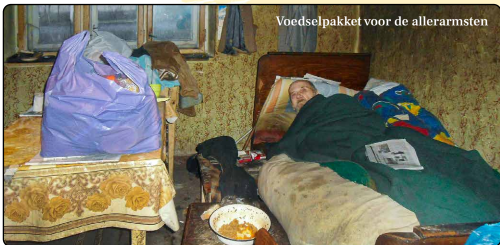
Voedselpakket voor de allerarmsten

Sinds de Russische inval heeft plaatsgevonden zijn de prijzen van dagelijkse levensmiddelen behoorlijk gestegen. Vooral voor arme en hulpbehoevende mensen is het steeds moeilijker geworden om hun dagelijkse boodschappen te kunnen betalen. Dit geldt nog meer als men zelf geen tuin of stukje grond heeft, waarop voedingsmiddelen verbouwd kunnen worden.