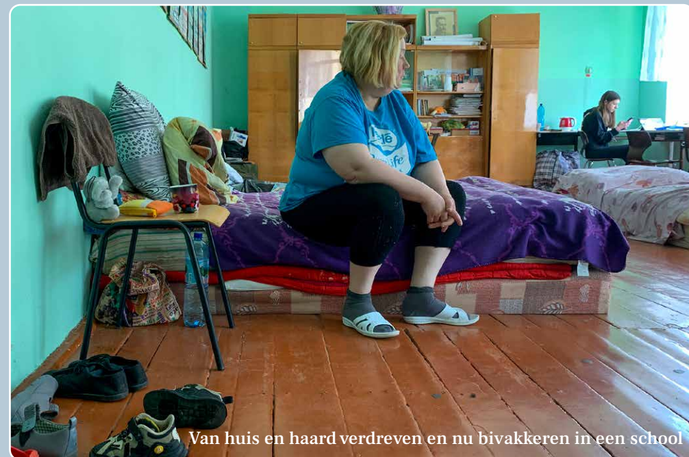
Van huis en haard verdreven en nu bivakkeren in een school