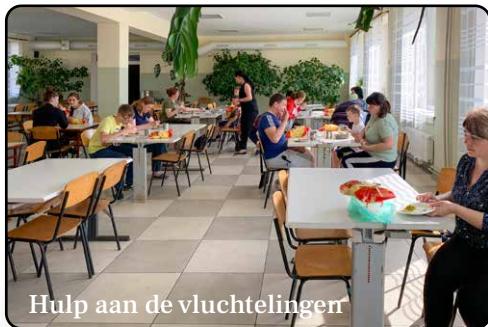
Hulp aan de vluchtelingen