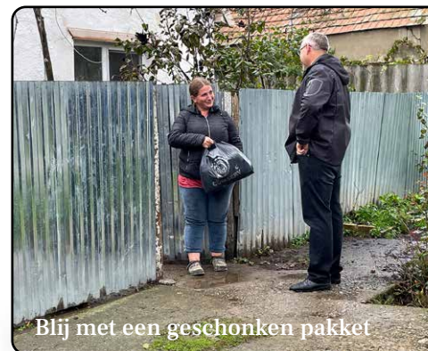
Blij met een geschonken pakket