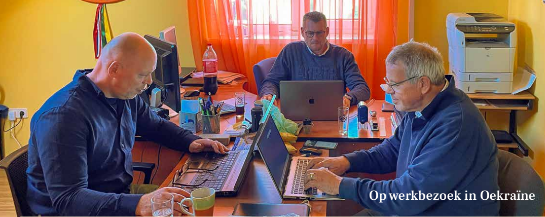
Op werkbezoek in Oekraïne

opgeroepen om deel te nemen aan het Oekraïense leger in de strijd tegen de Russen. De meegebrachte goederen die tijdens het werkbezoek in het magazijn boven Rehoboth waren opgeslagen sinds het vorige werkbezoek, zijn bijna allemaal op de plaats van bestemming gebracht.