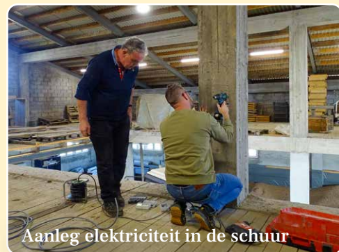
Aanleg elektriciteit in de schuur