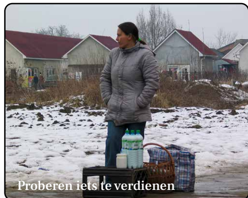
Proberen iets te verdienen